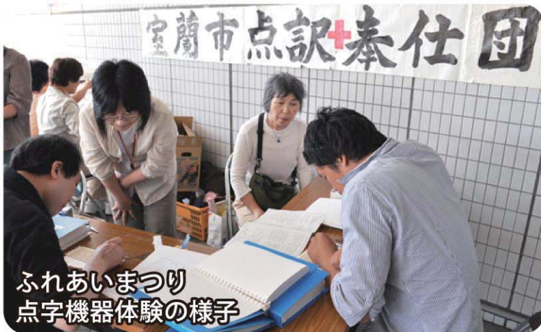
ふれあいまつり 点字機器体験の様子

室蘭社協のボランティア講座にて、点字を打っていく感触に夢中になり、活動を始めました。小学校での点訳教室では、子どもたちが自分で点字を打ち、喜んでくれました。点字は学ぶほど奥が深く、面白いですよ！ぜひ体験してみませんか？