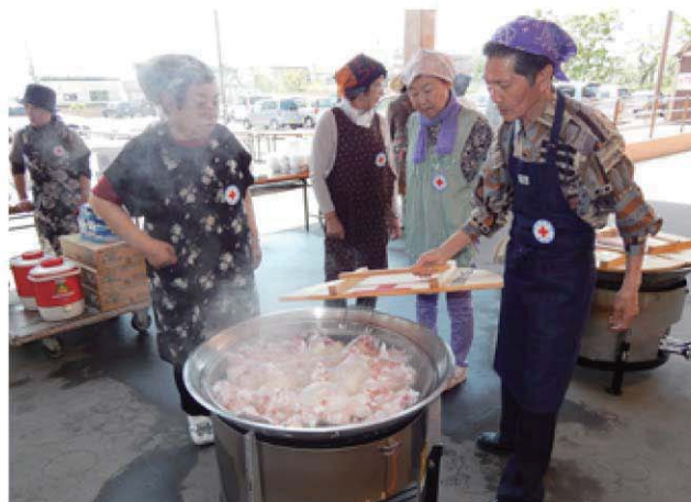
地域奉仕団の炊出し訓練の様子

災害救援活動などを行う民間の団体です。 災害に備えた訓練、救援物資の備え、救急法普及、ボランティアの養成などを行います。 また、各地でボランティアとして 赤十字奉仕団 が結成されています。 室蘭市地区では、地域・点訳・スキーパトロール・無線・水上安全・救急法の各奉仕団が活躍中です。