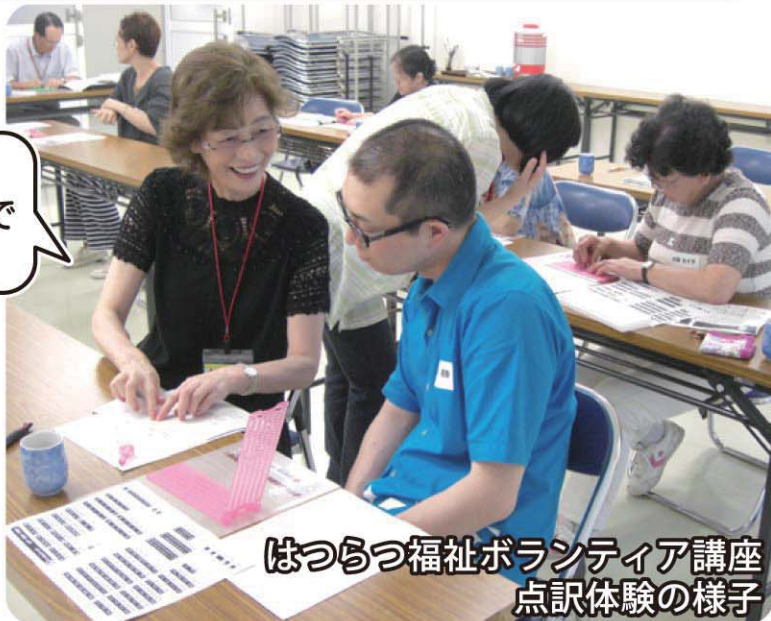
はつらつ福祉ボランティア講座 点訳体験の様子

本を丸ごと点訳した 点訳本 は、紙に凹凸をつけるため、もともとの 5倍 ほどにかさばります。 わずかな違いで全く違う意味になるため、何度もチェックをします。 一冊完成するまで、 半年 ほどかかることも。